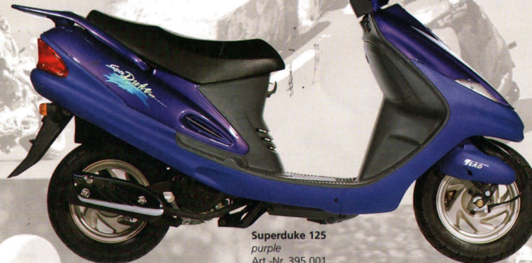
Superduke 125 purple Art.-Nr. 395 001