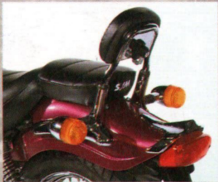
Fahrvergnügen auch für den Mitfahrer - die Rückenlehne der Husky Sitzbank