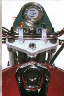
Mit Liebe zum Detail - klassisches Chopper-cockpit mit Blick für das Wesentliche