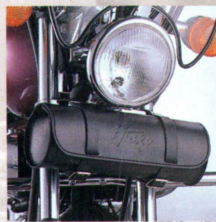
Projektagentur Fuchs, Fürth