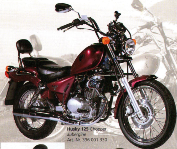
Husky 125 Chopper aubergine Art.-Nr. 396 001 330