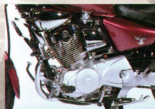
Kraftquelle und Augenschmauser der 1-Zylinder 4-Takt-Motor des Husky