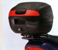
Sonderzubehör für zusätzlichen Stauraum, das abnehmbare Top-Case