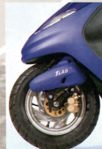
Für Fahrersicherheit und gute Verzögerung - die Scheibenbremse am Vorderrad.