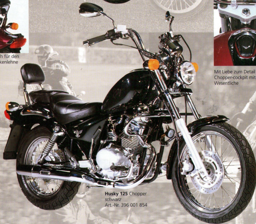
Husky 125 Chopper schwarz Art.-Nr. 396 001 854