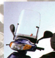
Für Wind- und Witterschutz. Windschild als Sonderzubehör