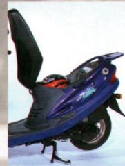
Integriertes Helmloch unter der abschließbaren Sitzbank