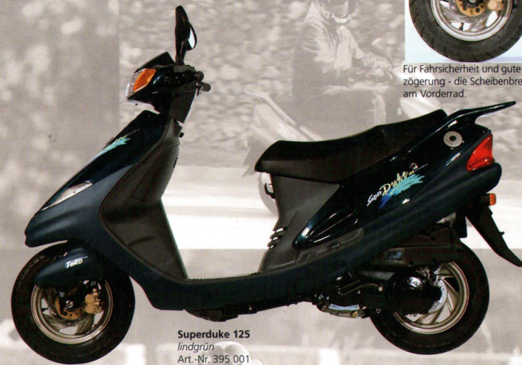
Superduke 125 lindgrün Art.-Nr. 395 001