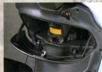
Abschließbares Handschuhfach mit großzügigem Stauraum